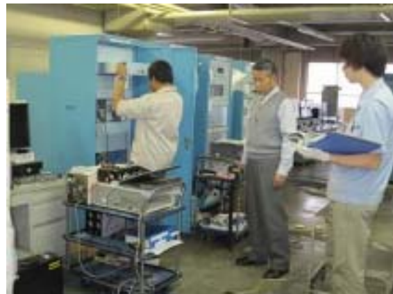
Audio Matrix 装置の工場検査立会風景