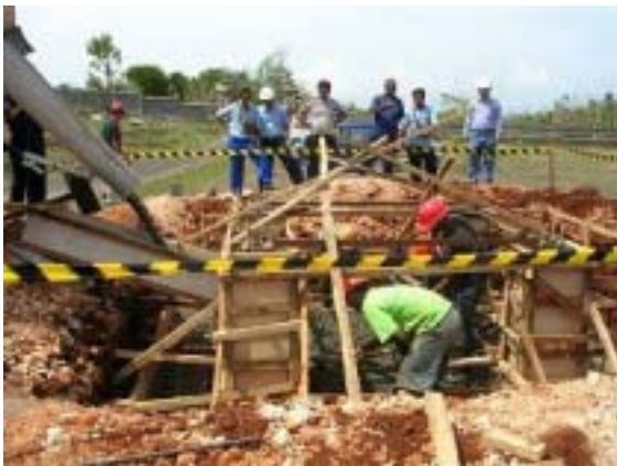
新送信所(2 級局)の鉄塔(20m)基礎工事（バリ島）